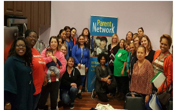
Adiestramiento Acceso al Currículo General , HUNE Otoño 2016